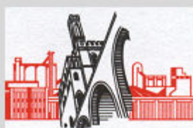
Cementerie Aldo Barbetti S.p.A.