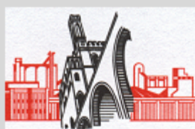
Cementerie Aldo Barbetti S.p.A.